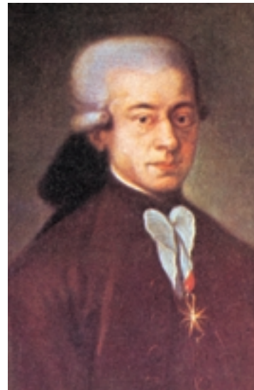
W.A. MOZART (1756-1791). Aspetto somatico caratteristico della costituzione omeopatica "calcarea fluorica".

"Le Costituzioni Omeopatiche" PARTE PRIMA è stato pubblicato nella rubrica "Homoeopathicum" de La Medicina Biologica, Aprile-Giugno (2), 2000, pagg. 43-50.