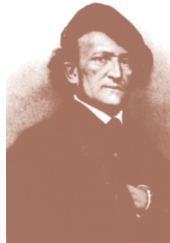
W. R. Wagner (1813-1883). Aspetto somatico caratteristico della costituzione omeopatica "Natrium muriaticum"