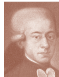
W.A. MOZART Calcarea fluorica