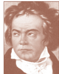
L. Van BEETHOVEN Sulphur