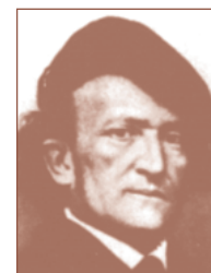
W. R. WAGNER Natrium muriaticum