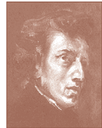
F.F. CHOPIN Calcarea phosphorica